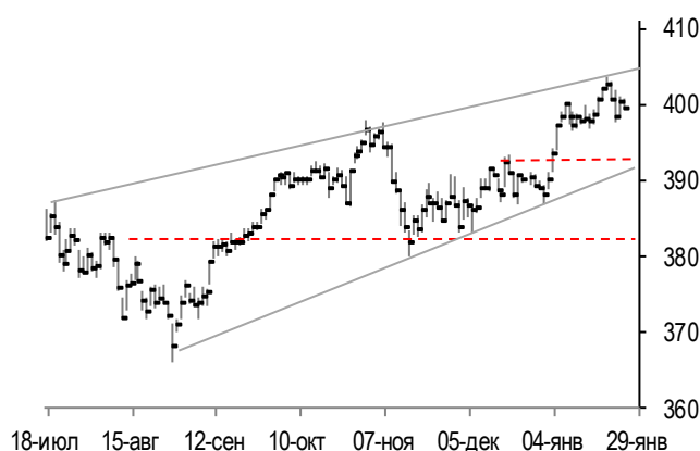
График фондового индекса евро STOXX 600 (daily)