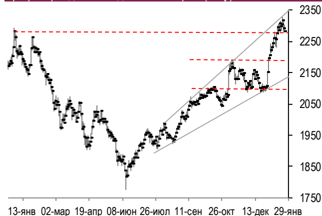
График фондового индекса МосБиржи (daily)

Рынок акций РФ в понедельник снизился. Индекс МосБиржи просел на 0,48% при оборотах торгов почти на четверть выше среднемесячных. При этом наибольшее негативное воздействие на него оказало падение в цене акций Магнита (-6,9%), Газпрома (-1,7%) и Лукойла (-1,1%). Сдержало понижение индекса МосБиржи повышение котировок обыкновенных акций Сбербанка (+1,4%), Норникеля (+1%) и МосБиржи (+2,1%).