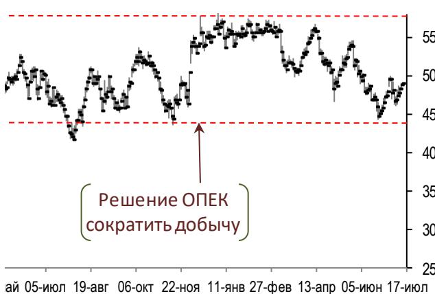
Динамика цен на нефть Brent (daily)