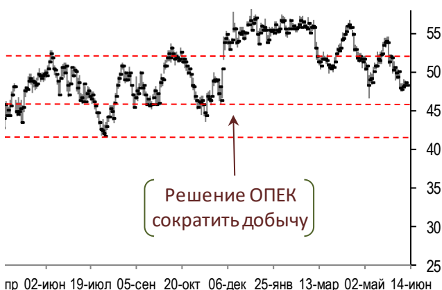
Динамика цен на нефть Brent (daily)