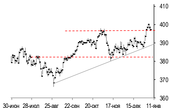
График фондового индекса евро STOXX 600 (daily)