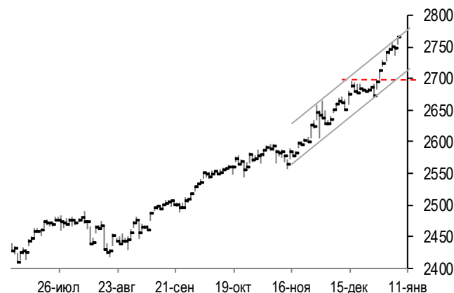
График фондового индекса S&P500 (daily)