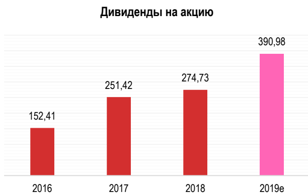
Рис. 1. Дивиденды «Полюса»