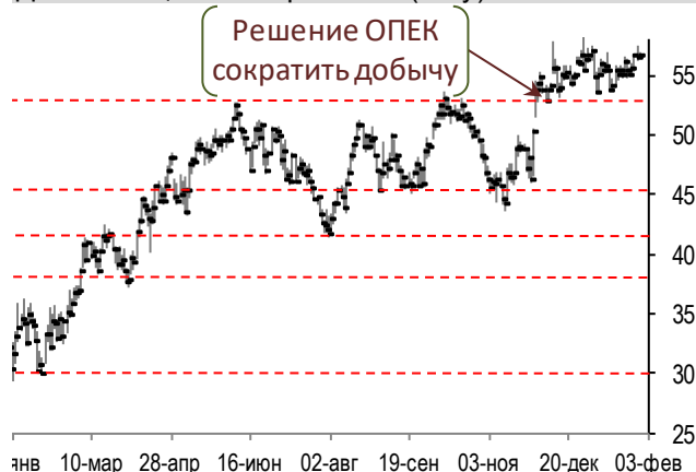
Динамика цен на нефть Brent (daily)