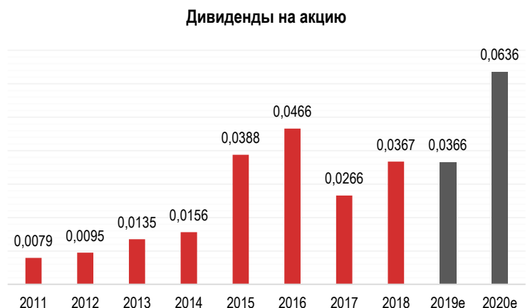
Рис. 1. Дивиденды «РусГидро»