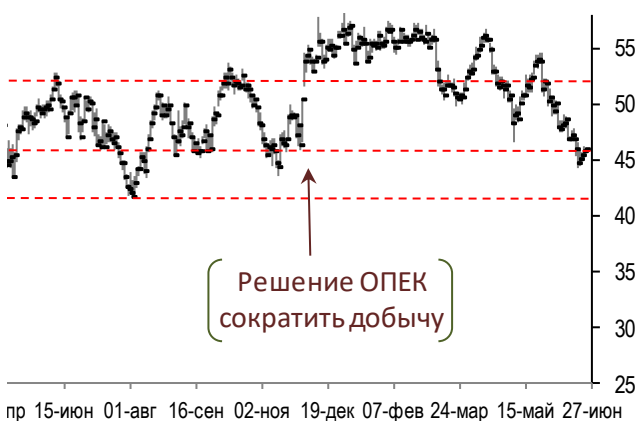
Динамика цен на нефть Brent (daily)