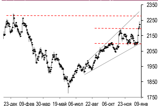
График фондового индекса МосБиржи (daily)

Рынок акций РФ во вторник вырос. Индекс МосБиржи поднялся на 0,81% при оборотах торгов на 2/3 выше среднемесячных, а наибольшее положительное влияние на него вновь, как и в предыдущий торговый день, оказало повышение в цене обыкновенных акций Газпрома (+2,1%) и Лукойла (+1,7%). Сдержало рост индекса МосБиржи снижение акций Магнита (-1,8%), Новатэка (-0,8%) и Polymetal (-2,5%).