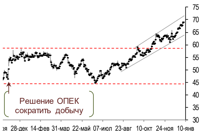
График цен на нефть Brent (daily)