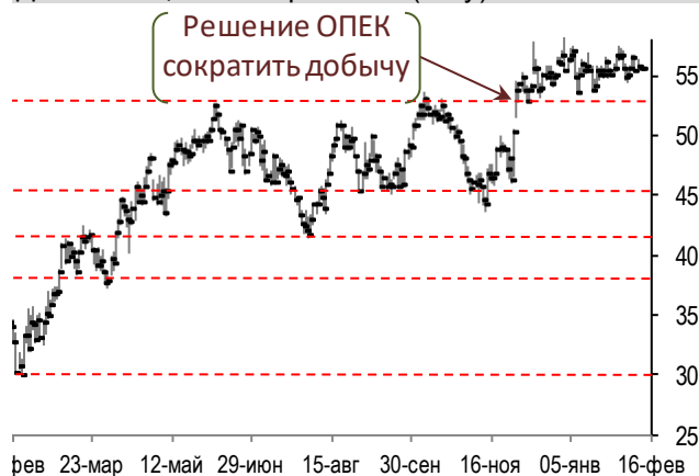
Динамика цен на нефть Brent (daily)